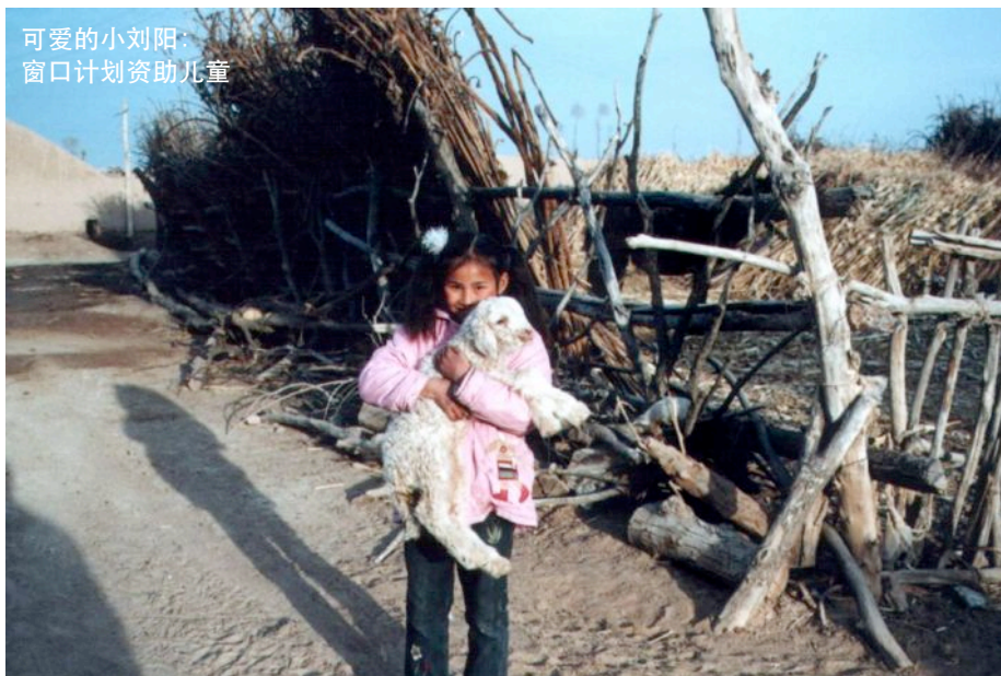
可爱的小小阳： 窗口计划资助儿童